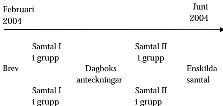
Figur 1. Det empiriska genomförandet över tid

Vid ett personalmöte i januari 2004, fick jag möjlighet att presentera forskningsprojektet. Under introduktionen av min studie gjorde jag en genomgång av olika tankar bakom framväxten av en skola för alla och om olika synsätt på elever i behov av särskilt stöd. Personalgrupperna tillfrågades om de var villiga att tillsammans med sina arbetskamrater inför två olika tillfällen läsa några utvalda artiklar som underlag för samtal i grupper. För att ge möjlighet till eftertanke kunde anmälan ske via mail eller handskrivet brev. Sjutton av skolans tjugo pedagoger och elevvårdande personal anmälde sitt intresse att delta i studien. I studien refereras alla som pedagoger oavsett vilken tjänst de innehar eftersom de i sina arbetsuppgifter samtliga har en pedagogisk funktion. De tre som avstod, angav personliga skäl eller att de arbetade på många olika skolenheter. Studien försiggick under en termin enligt följande: